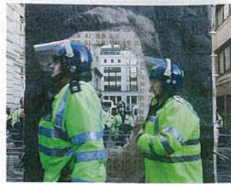
oben: KennardPhillipps wollten sich mit ihrer Kunst direkt in die politische Debatte einmischen. Mit Erfolg: Demonstranten zogen am 9. November 2011 mit ihrem Plakat Occupy durch Londons Straßen unten links: Mit ihrem Musikvideo The Grand Rapids LipDub (2011) wehrte sich Grand Rapids/Michigan gegen die Behauptung, eine sterbende Stadt zu sein. unten rechts: mit dem Video Ser y durar (2011) will die spanische Künstlergruppe La Democracia an vergessene Kapitel der Geschichte erinnern

Künstlergruppe „Buuuuuuuuu“ auf. Sie fordert Ausstellungsbesucher auf, sich mit einem „einminütigen Lächeln gegen Berlusconi“ von einer Kamera aufnehmen zu lassen und sich damit in eine öffentliche Protest-Galerie gegen den Politiker einzureihen. „Buuuuuuuu“ spielt mit dem Bekenntnisdrang der Nutzer sozialer Medien wie Facebook. Doch sind sie auch bereit, für ihre politischen Überzeugungen ihr Gesicht herzugeben? Mancher Betrachter des Werks von „Buuuuuuuu“ behielt dann doch lieber seine Meinung für sich. Wer mitmachte, findet seine Bekenners-Lächeln auf der Website der Künstlergruppe, www.buuuuuuuu.net, wieder.