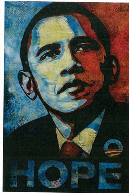
oben: Das Hope-Plakat von Frank Shepard Fairry (geb. 1970), das er im Zuge der Obama-Wahlkampagne zur US-Präsidentenwahl 2008 entwarf, lässt Realpolitik mit Populärkultur verschmelzen unten: Wenig vertrauenswürdig erscheint Tony Blair trotz Gewinner-Lächeln: KennardPhillipps schaffen in ihrer Fotomontage Photo Op (2005) ein irritierendes und ironisierendes Bildsujet