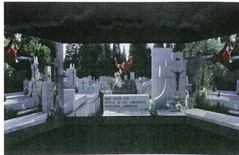
Kann Kunst die Welt verändern?